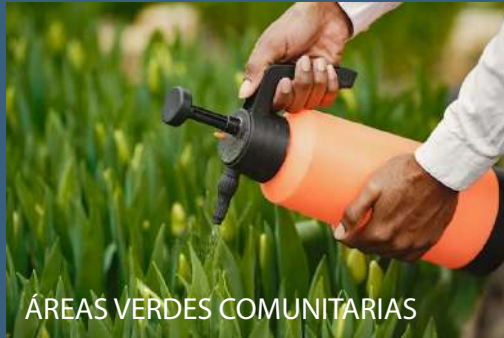
ÁREAS VERDES COMUNITARIAS