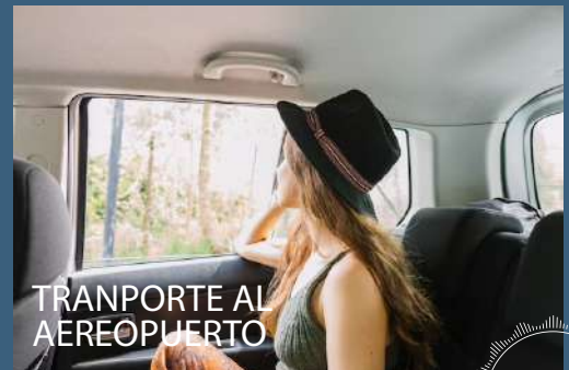
TRANPORTE AL AEROPUERTO