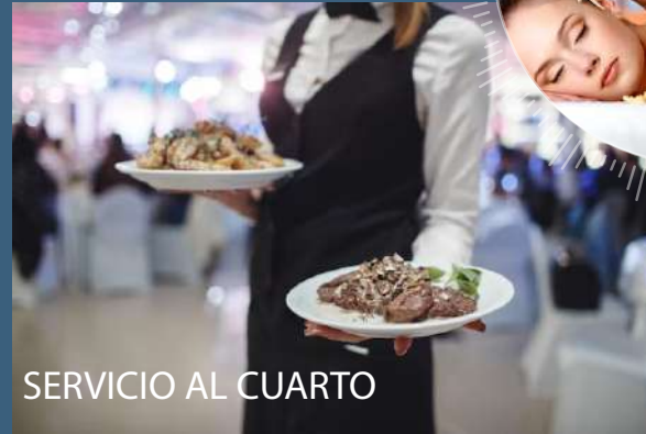
SERVICIO AL CUARTO