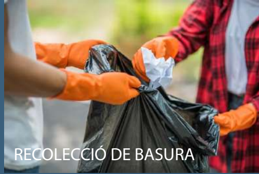
RECOLECCIÓN DE BASURA