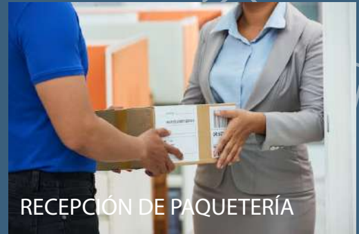
RECEPCIÓN DE PAQUETERÍA