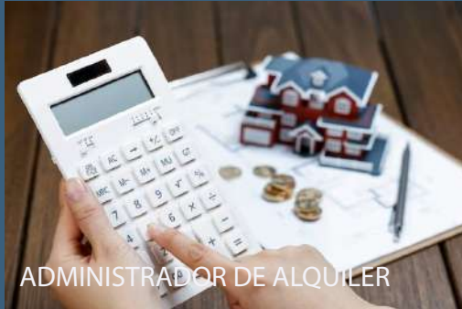
ADMINISTRADOR DE ALQUILER